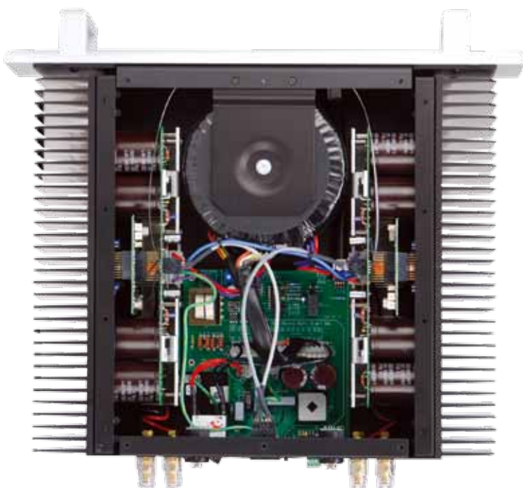
Bryston 28BSST 2

從內部可以看出這次改款的最大不同，整體架構承襲經典，但細節優化了許多，諸如電路版的連接、布局路徑的簡化，以及電源供應強化等，至於影響聲音最大的輸入級，也同樣經過強化。下面的控制與電源電路板經過整合之後，加入了軟開機的保護線路，讓整體的防護效果更好。兩側就是每聲道4對的OnSemi功率晶體，輸出超大的電流與超強的功率，另外可以看到溫度補償晶體上加了強化的鋼板，讓散熱效果更好，聲音表現當然也更加穩定。